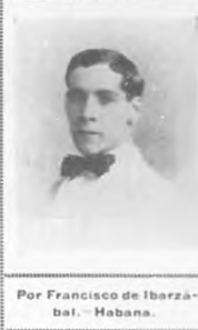
Por Francisco de Ibarzábal.—Habana.

Yo creo que este apreturamiento, festinado y comprometedor del éxito final, con que nuestros artistas se lanzan á la publicación de sus primeras obras, no es sino otra sintomática manifestación de nuestro carácter impulsivo, improvisador y desproporcionado. La paciencia tesonera y ponderativa no cuenta entre nuestras cualidades idiosincráticas. Eso explica nuestra total penuria de pintores y escultores—cuyo arte precisa cultura larga y sometimiento á cánones y preceptos sólo domeñables tras una experiencia disciplinada de largo tiempo.