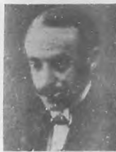
POR M. MARTÍNEZ SIERRA RENACIMIENTO—MADRID.

hilos y escotillones, presentar los histriones sin afeites ni ahuecamientos de voz y llevar adelante el acto de farándula sin apuntador, hará mal si continúa la farsa. Fuera vil en gaño y lo que antes se aplaudió como industria del talento desenvuelto á la sombra de un trato leal, en tal caso habría que rechazarlo como á desesperada maña de charlatán sin dignidad ni fuero de arte á quien los desdenes justicieros de la gente precipitarán á tales menguas.