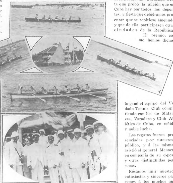
EN CARDENAS.—Regatas en "Varadero". Varios aspectos de la animada fiesta. En primer término la canoa vencedora.

gado "Tennis Club" y á fe que la victoria que le hizo dueño definitivo de la "Copa Varadero" no pudo causar sorpresa por que son los remeros del Tennis constantes en la preparación y siempre van á la lucha perfectamente entrenados.