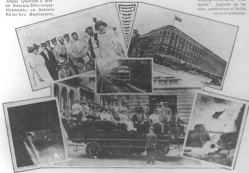
LA EXCURSION AL NIAGARA.—Grupo de excursionistas cubanos en el Central Park de New York. Hotel Internacional del Niágara donde se hospedaron los excursionistas. Ferrocarril de New York á Buffalo. Las cataratas vistas de noche. Automóvil con los excursionistas. La cueva de los vientos.

En ambos viajes, ida y vuelta, los vapores han realizado una travesía deliciosa en que la "inmensa llanura" cooperó con su quietud de modo muy eficaz, al mayor placer; atravesando el temido cabo "Hatteras" con la mar tan tranquila, que en la banda de babor todo el pasaje pudo contemplar el solitario "Diamond", juguete de las olas, poniéndose al habla con la tripulación.